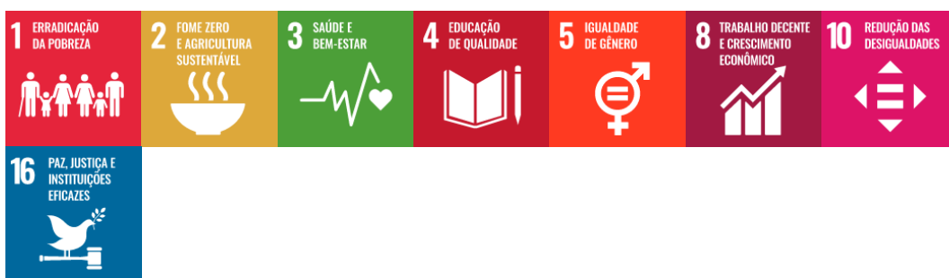
Figura 19 – Integração da Dimensão Assistência Estudantil com os Objetivos de Desenvolvimento Sustentável

Objetivo 11 – Promover políticas para assegurar a permanência dos estudantes, na perspectiva de garantir a participação ativa e plena formação cidadã e profissional.