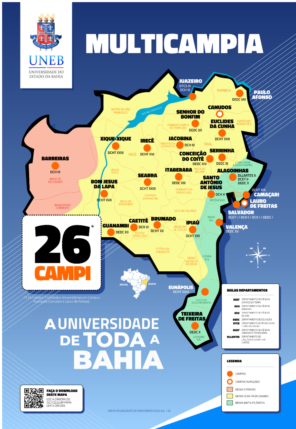
Figura 1 – Sistema Multicampi da UNEB