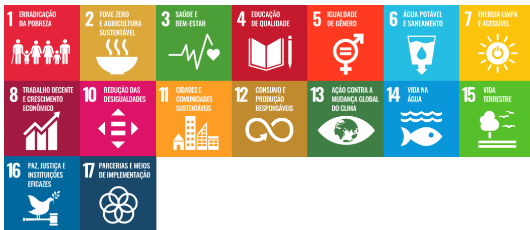
Figura 13 – Integração da Dimensão Pesquisa e Inovação com os Objetivos de Desenvolvimento Sustentável

Objetivo 5 – Promover e ampliar a pesquisa científica e estimular a inovação em consonância com ações de um mundo internacionalizado, voltadas para a sustentabilidade, para a sociedade, meio ambiente e matrizes energéticas.