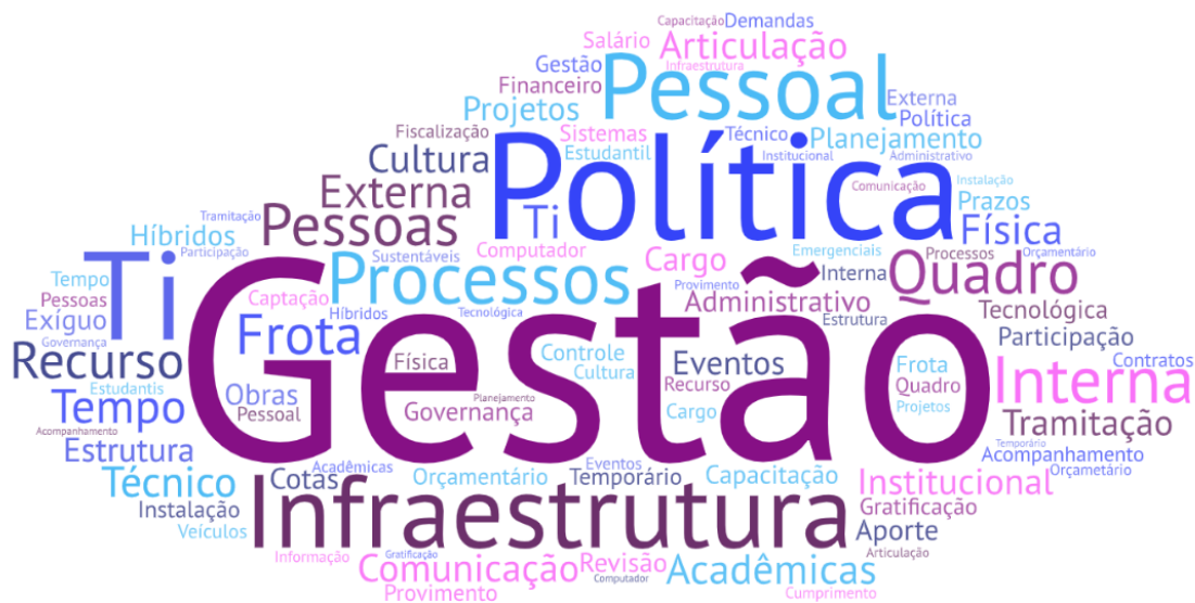
Figura 3 – Nuvem de Palavras: Fraquezas

No que se refere às fraquezas verifica-se a maior frequência dos seguintes termos: infraestrutura, comunicação e quadro de pessoal. É importante ressaltar que a palavra “gestão”, muito evidenciada na nuvem, se apresenta conjugada com outros termos a exemplo de gestão de pessoas, gestão de processos e gestão acadêmica.