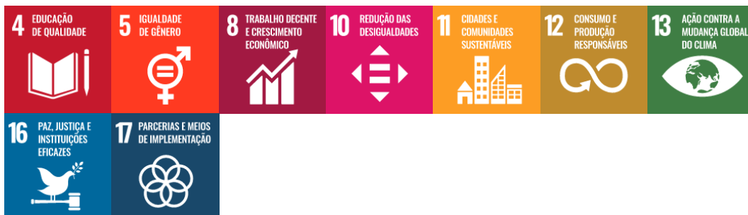
Figura 9 – Integração da Dimensão Graduação com os Objetivos de Desenvolvimento Sustentável