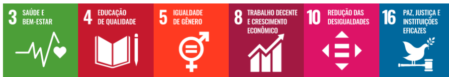
Figura 16 – Integração da Dimensão Gestão de Pessoas com os Objetivos de Desenvolvimento Sustentável

Objetivo 8 – Prover as condições necessárias para o pleno desempenho das atividades institucionais e a contínua qualificação dos servidores que atuam na Universidade.