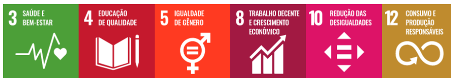
Figura 18 – Integração da Dimensão Planejamento e Avaliação com os Objetivos de Desenvolvimento Sustentável