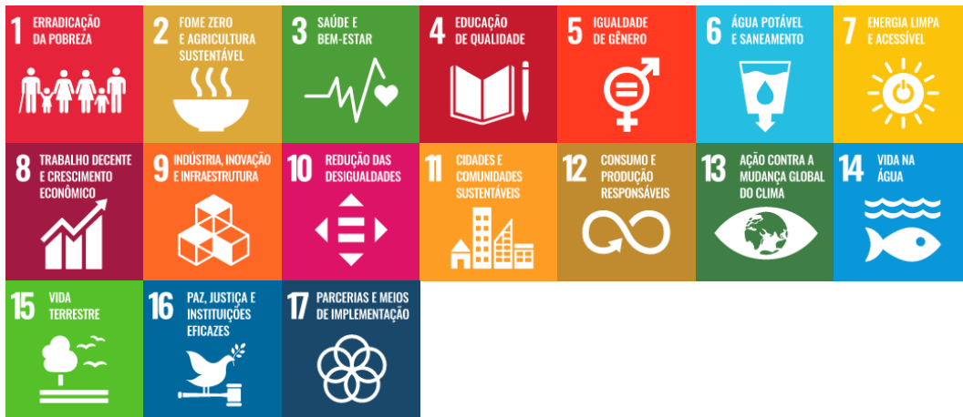
Figura 10 – Integração da Dimensão Pós-Graduação com os Objetivos de Desenvolvimento Sustentável