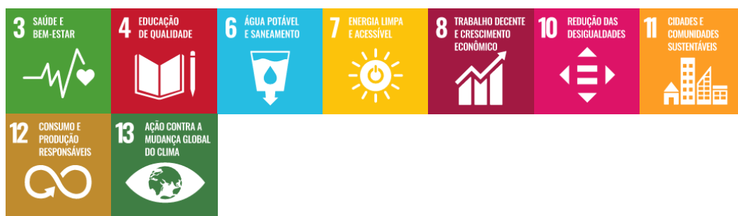
Figura 17 – Integração da Dimensão Infraestrutura com os Objetivos de Desenvolvimento Sustentável

Objetivo 9 – Ampliar e modernizar a infraestrutura física e tecnológica da Universidade, de modo a assegurar a acessibilidade, a sustentabilidade e a reorganização e qualificação dos espaços.