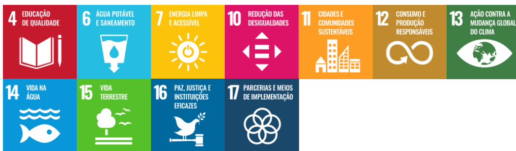
Figura 14 – Integração da Dimensão Internacionalização com os Objetivos de Desenvolvimento Sustentável

Objetivo 6 – Desenvolver políticas voltadas para ampliação das fronteiras da Universidade e qualificar a internacionalização institucional, de modo a expandir o conhecimento, a experiência profissional, alcançar a excelência acadêmica, científica, tecnológica e da inovação.