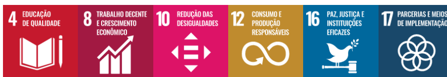
Figura 15 – Integração da Dimensão Gestão e Organização com os Objetivos de Desenvolvimento Sustentável

Objetivo 7 – Incrementar processos permanentes de qualificação da gestão, a partir da normatização, acompanhamento e implementação de melhores práticas, com a utilização da tecnologia, recursos orçamentários e financeiros, materiais e equipe de colaboradores.