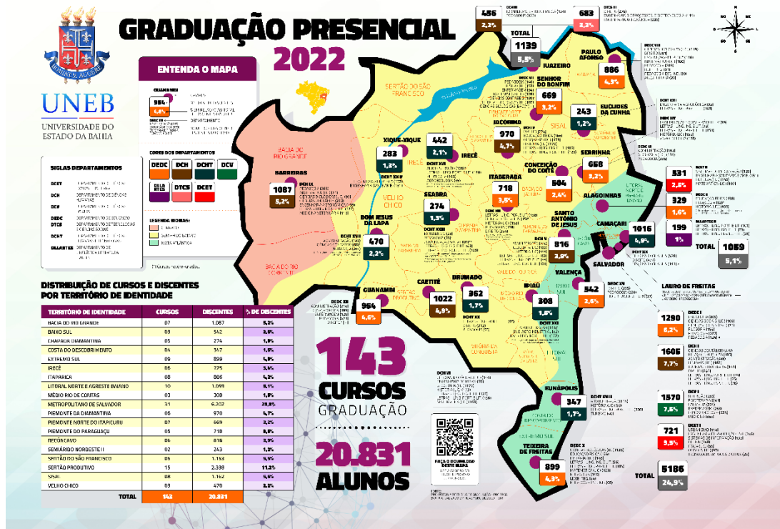
Figura 7 – Oferta de cursos de graduação da UNEB