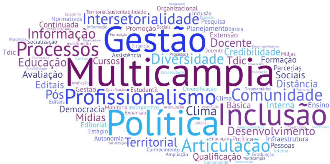
Figura 2 – Nuvem de Palavras: Forças

Quanto à composição da matriz SWOT, no que tange à forças, observa-se a predominância do formato multicampi da Instituição, da política de inclusão, do profissionalismo dos seus servidores, da capacidade de articulação com a educação básica e as políticas sociais, da credibilidade institucional e da pesquisa e inovação.